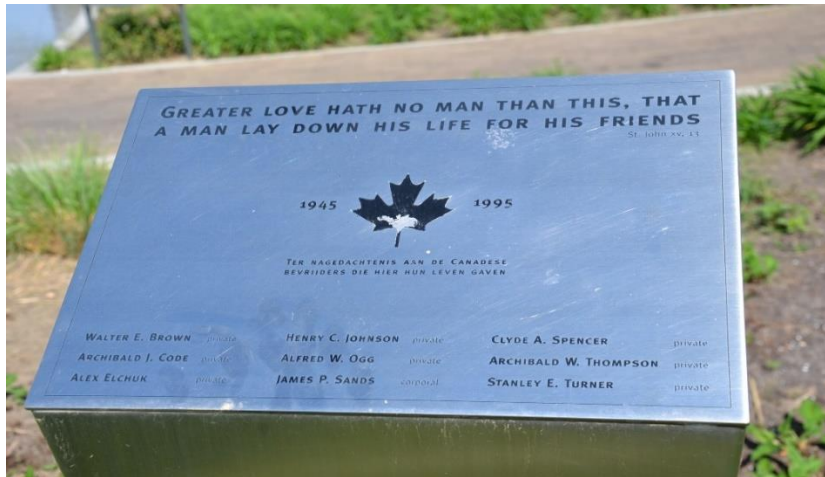
Monument in Doetinchem in het Mark Tennantplantsoen