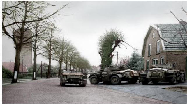
Canadese verkennersseenheid aan de Terborgseweg, 1 april 1945

Eind maart is het eindelijk mogelijk de Rijn over te steken en kan een enorme troepenmacht beginnen aan de bevrijding van Oost- en Noord-Nederland. De Canadezen trekken via Ulft, Terborg en Gaanderen op richting Doetinchem. Op 1 april, het is Eerste Paasdag, bereiken ze via de Terborgseweg de rand van de stad. Het is de bedoeling