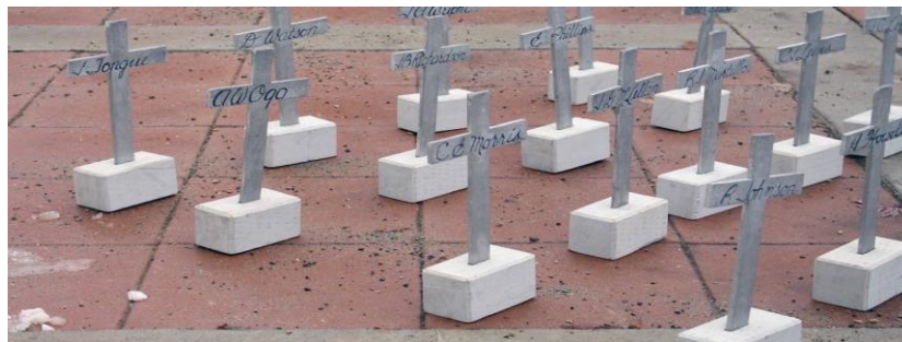
Remembrance Day, Rossland, November 2017